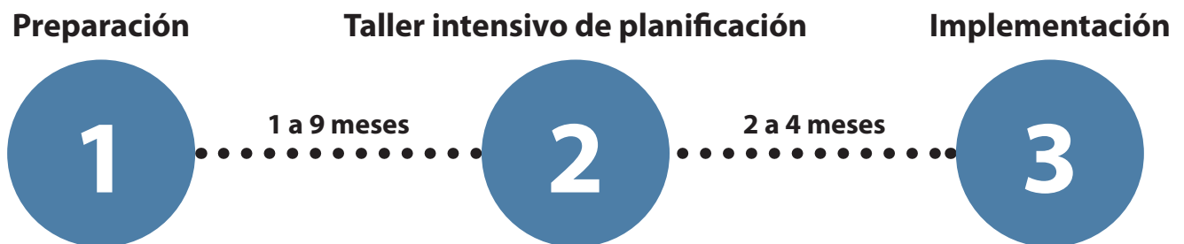
Figura 1. Marco de tres fases del charrette (s.d. de NCI)

Organizar un taller intensivo de planificación requiere preparación. Muchos de los pasos descritos en esta sección